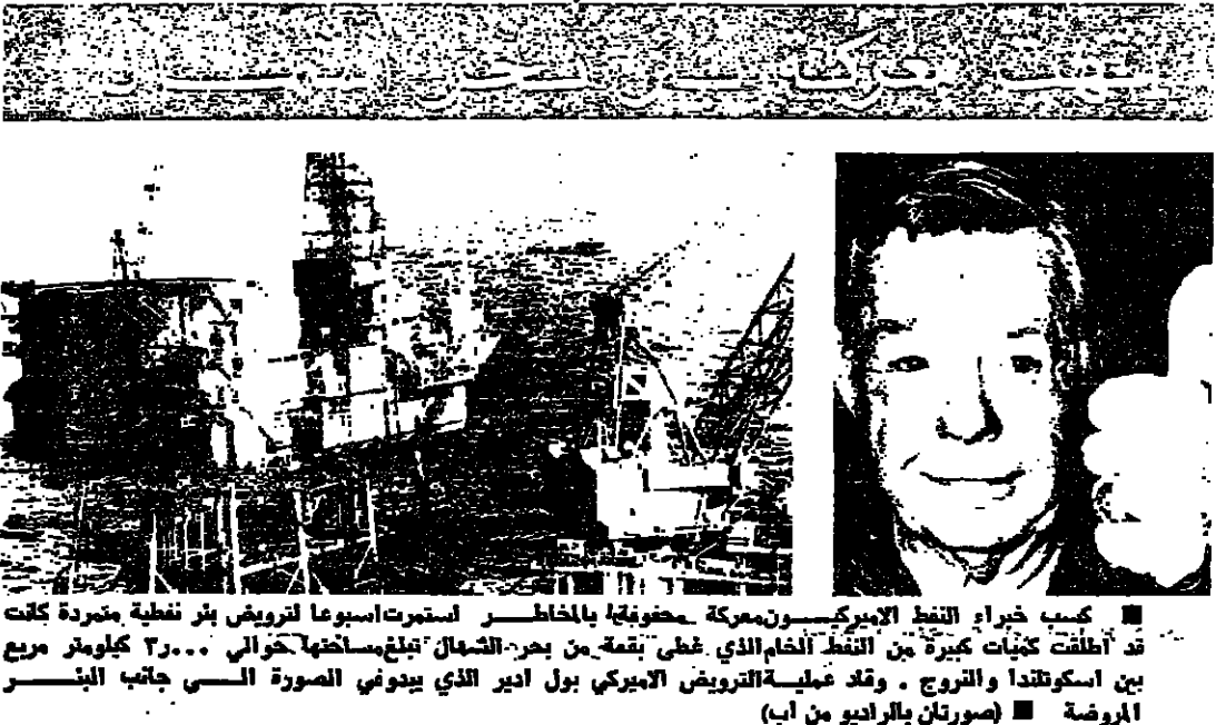
(صورة للبراري من اب)

عليها كبار المسؤولين في مصر استغرقت عدة ساعات . وفي موسكو ، انضم الي كبار الزعماء السوفيات في عرض سنوي اقيم في ساحة موسكو الحمراء بمناسبة يوم الاول من ايار لوس كورنلان الزعيم القبطي الذي كان قد اتفرج عنه من السجن في مقال اطلق سراح فلاديمير بوتوكسكي القبط السوفياتي . وفي مدريد - سرق پوليس بكلمة الشعب مظاهرات جرت عشية عيد العمال - تم جرت تظاهرات لاحقة متحمية امرا حكومي . وفي باريس - احتفلت فرنسا اليوم بعيد العمال واسم الاحتفال الفرنسي بعدد من الاثريات في بعض المنظمات مثل التليفزيون وعدد من خطوط التويست وغيرها .